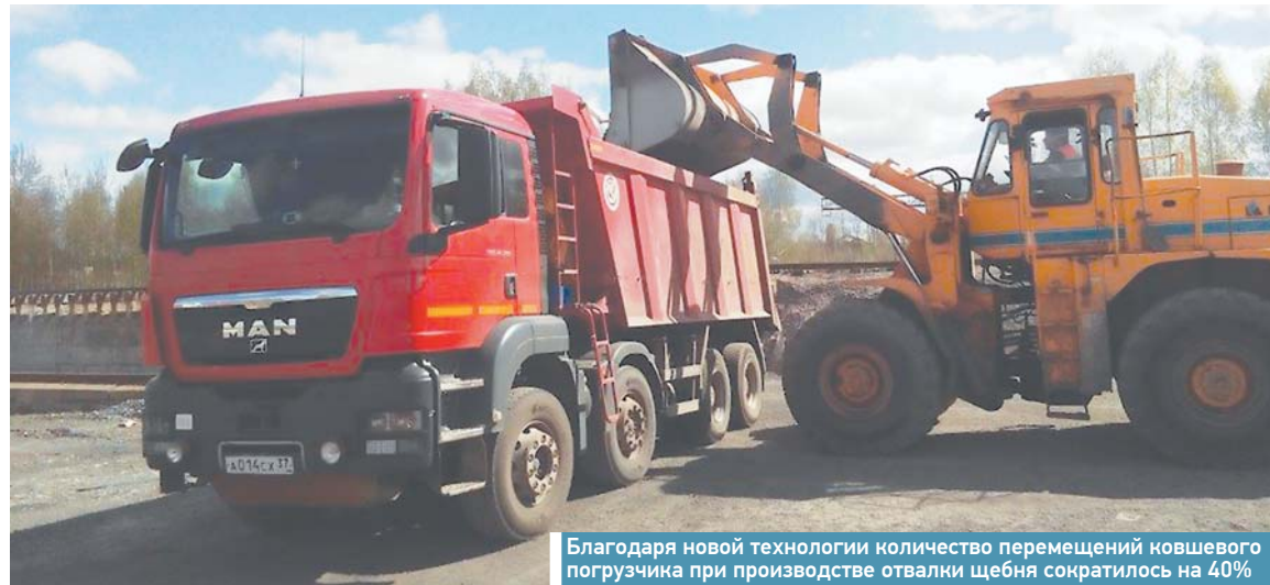
Благодаря новой технологии количество перемещений ковшевого погрузчика при производстве отвалки щебня сократилось на 40%

С 2014 по 2018 год в дистанции внедрён ряд проектов, идеи