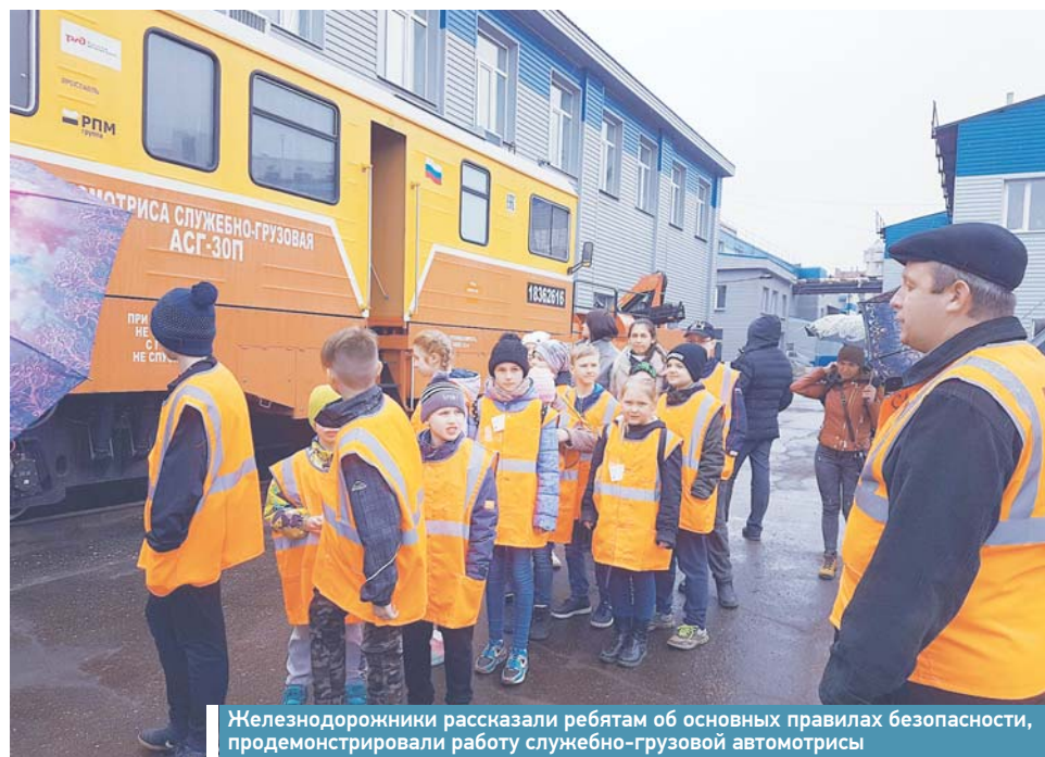
Железнодорожники рассказали ребятам об основных правилах безопасности, продемонстрировали работу служебно-грузовой автомотрисы

В преддверии Всемирного дня охраны труда, который отмечается 28 апреля, на Северной железной дороге проходят различные профилактические мероприятия, направленные, в том числе, на предупреждение случаев травмирования детей и подростков в зоне движения поездов.